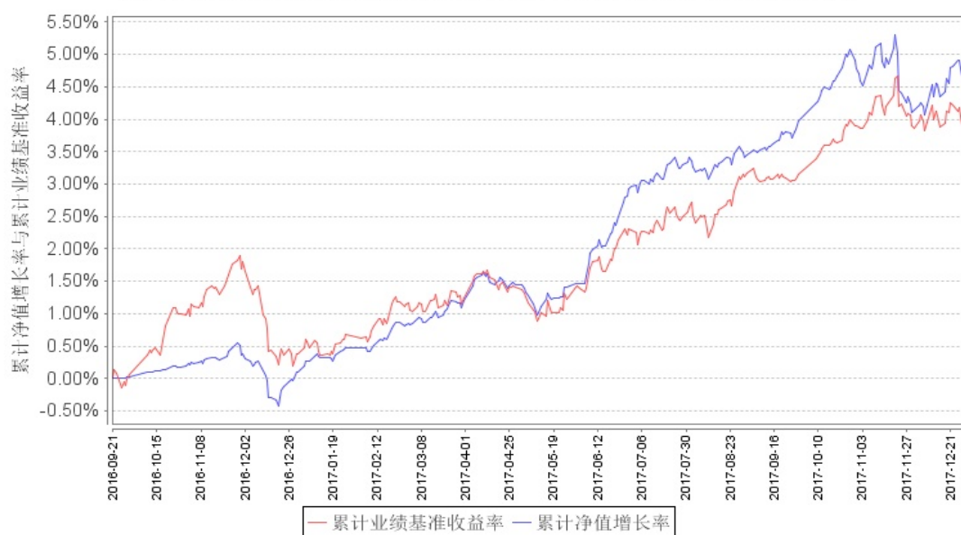
累计净值增长率与同期业绩比较基准收益率的历史走势对比图