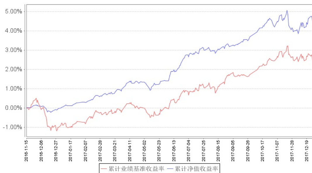
南方安裕养老混合累计净值增长率与同期业绩比较基准收益率的历史走势对比图