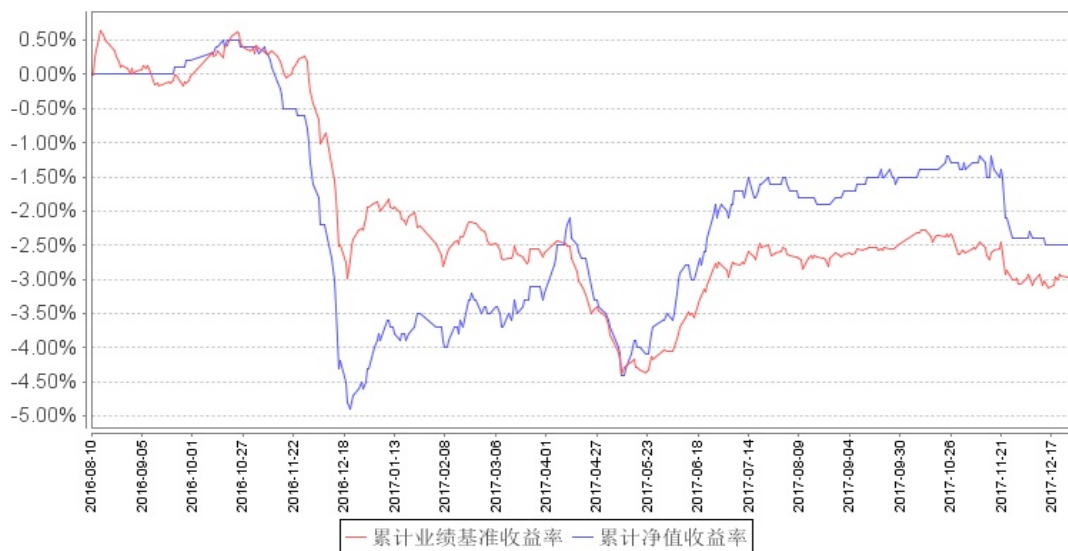
南方荣冠定期开放混合累计净值增长率与同期业绩比较基准收益率的历史走势对比图

注：本基金建仓期为自基金合同生效之日起 6 个月，建仓期结束时各项资产配置比例符合基金合同约定。