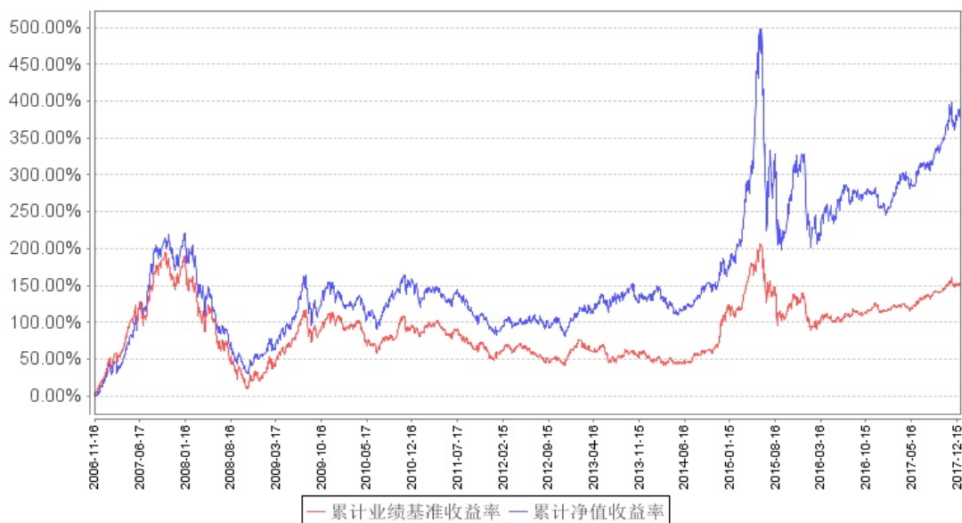
南方绩优成长混合累计净值增长率与同期业绩比较基准收益率的历史走势对比图