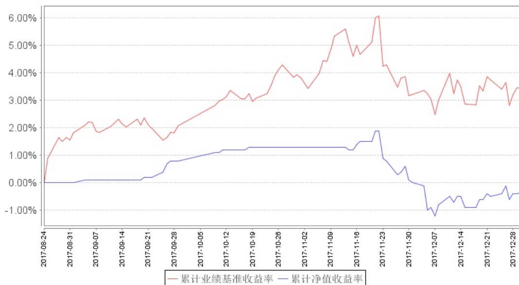
南方量化混合累计净值增长率与同期业绩比较基准收益率的历史走势对比图

注：本基金的基金合同生效日为 2017 年 8 月 24 日，本基金建仓期为 6 个月，报告期末建仓期尚未结束。