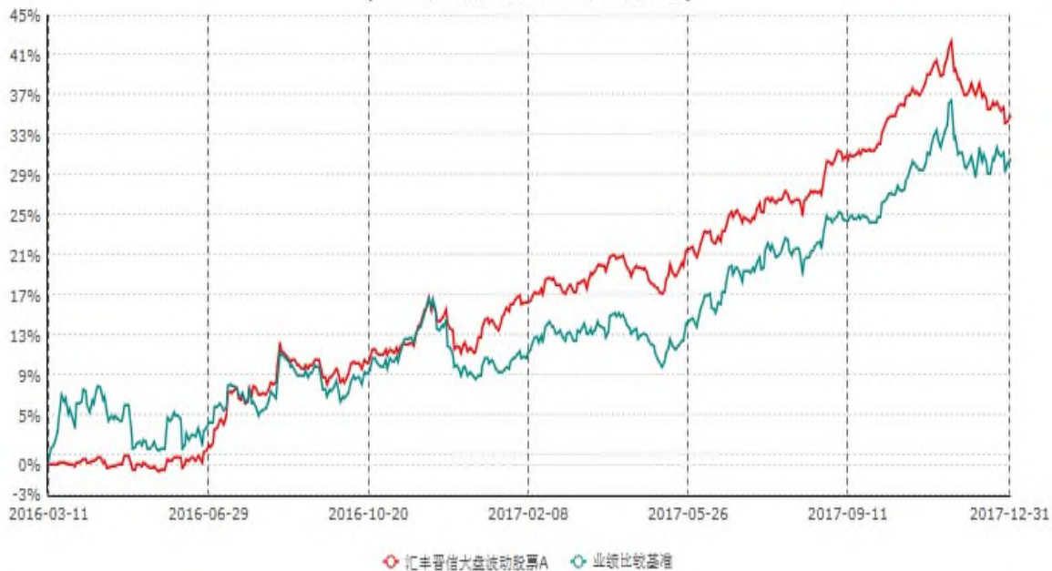
汇丰晋信大盘波动股票A累计净值增长率与业绩比较基准收益率历史走势对比图 (2016年03月11日-2017年12月31日)