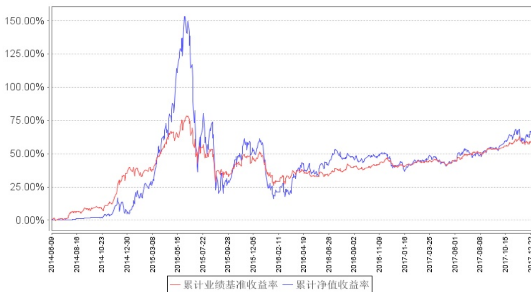
中国梦灵活配置混合累计净值增长率与同期业绩比较基准收益率的历史走势对比图