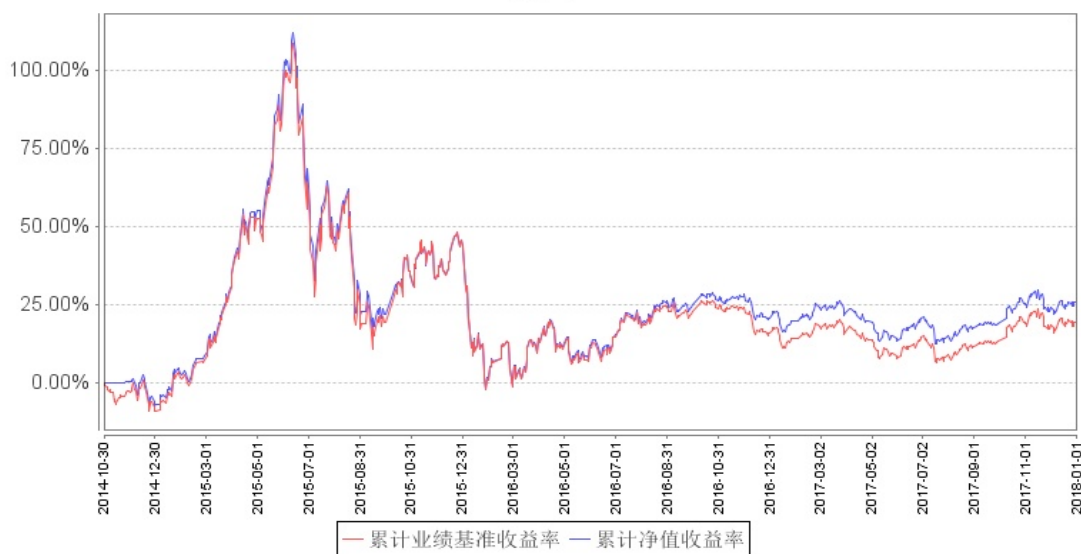
南方中证500医药卫生ETF累计净值增长率与同期业绩比较基准收益率的历史走势对比图