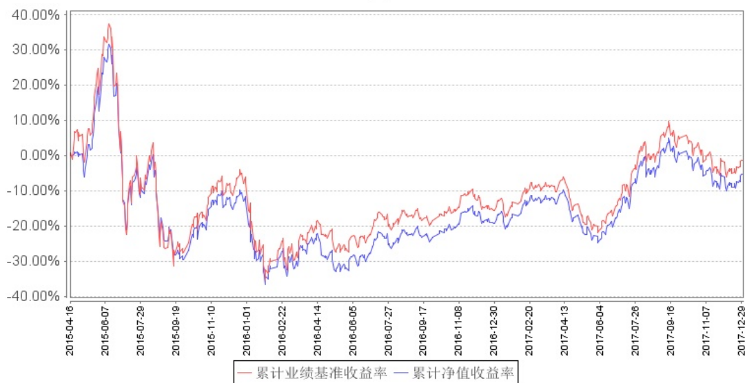
南方中证500原材料ETF累计净值增长率与同期业绩比较基准收益率的历史走势对比图