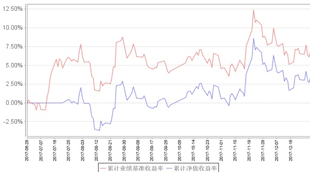
银行ETF累计净值增长率与同期业绩比较基准收益率的历史走势对比图

注：注：基金合同中关于基金投资比例的约定：本基金主要投资于标的指数成份股、备选成份股。在建仓完成后，本基金投资于标的指数成份股、备选成份股的资产比例不低于基金资产净值的90%。本基金的建仓期为三个月，建仓期结束时各项资产配置比例符合基金合同约定。