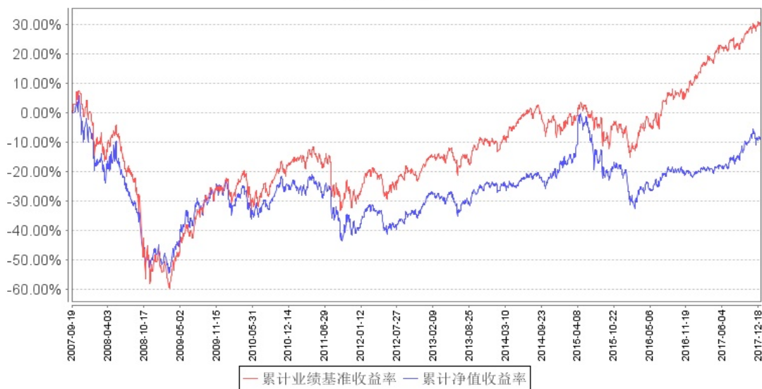
南方全球精选配置(QDII-FOF)累计净值增长率与同期业绩比较基准收益率的历史走势对比图