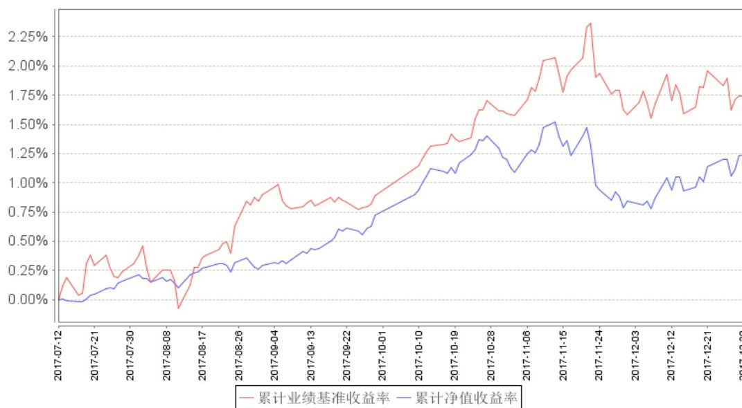
南方安睿混合累计净值增长率与同期业绩比较基准收益率的历史走势对比图

注：本基金的基金合同生效日为 2017 年 7 月 13 日，本基金建仓期为 6 个月，报告期末建仓期尚未结束。