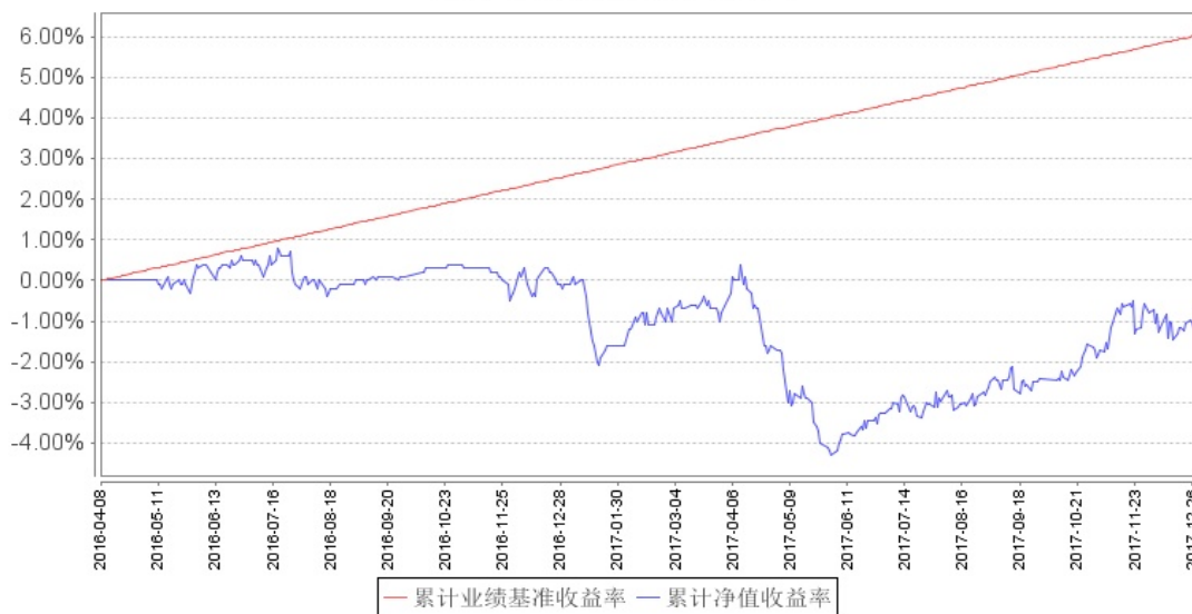
南方安享绝对收益策略定期开放混合型发起式累计净值增长率与同期业绩比较基准收益率的历史走势对比图