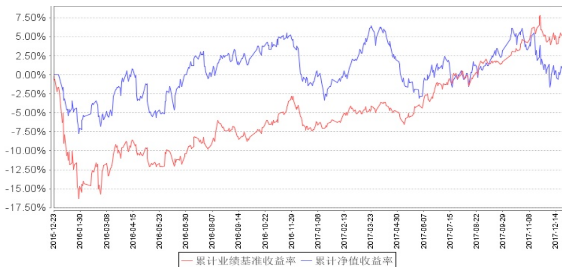
南方沪港深价值主题灵活配置混合累计净值增长率与同期业绩比较基准收益率的历史走势对比图