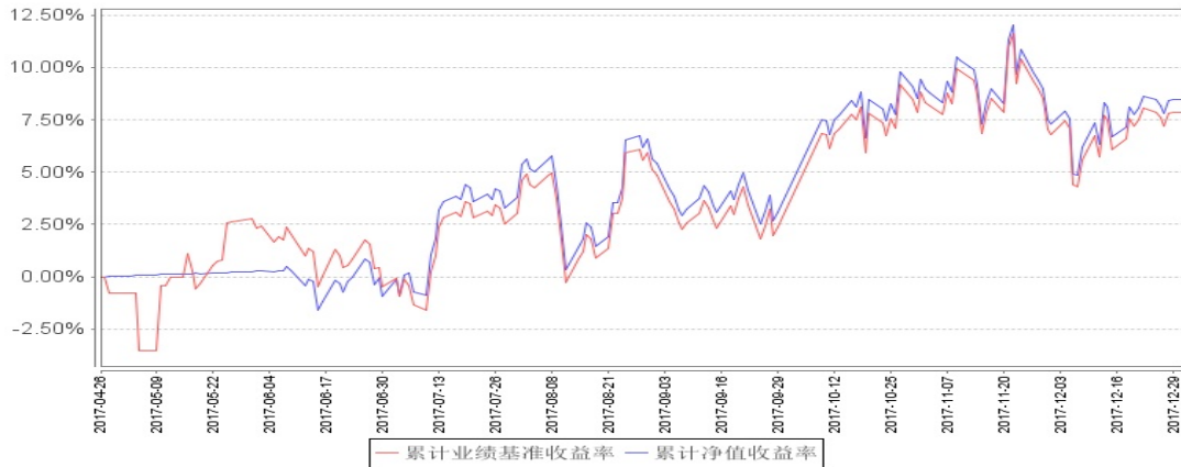
国企精明C累计净值增长率与同期业绩比较基准收益率的历史走势对比图