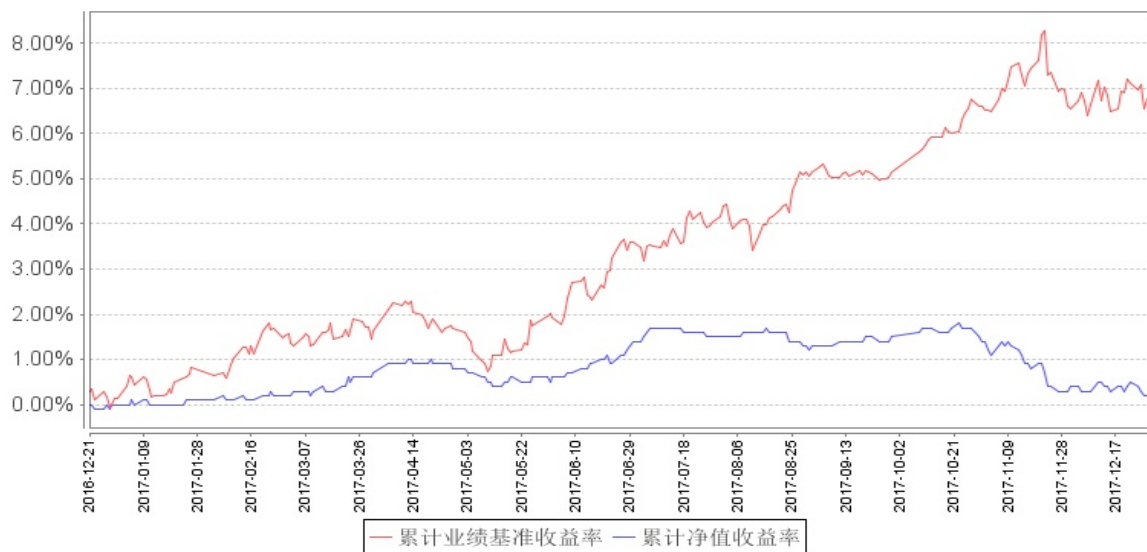
南方睿见定期开放混合发起累计净值增长率与同期业绩比较基准收益率的历史走势对比图

注：本基金建仓期为自基金合同生效之日起 6 个月，建仓结束时各项资产配置比例符合合同约定。