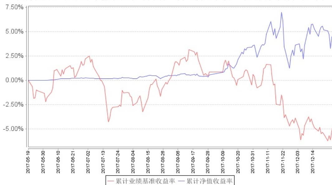
南方文旅混合累计净值增长率与同期业绩比较基准收益率的历史走势对比图

注：基金合同生效日至本报告期末不满一年。本基金建仓期为自基金合同生效之日起6个月，截至本报告期末，建仓期尚未结束。