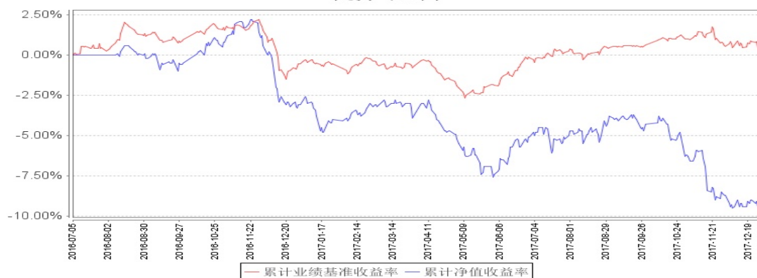
南方甄智定期开放混合型发起式累计净值增长率与同期业绩比较基准收益率的历史走势对比图

注：本基金建仓期为自基金合同生效之日起 6 个月，建仓结束时各项资产配置比例符合合同约定。