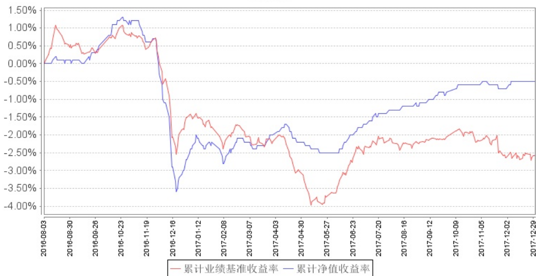
南方荣欢定期开放混合发起累计净值增长率与同期业绩比较基准收益率的历史走势对比图

注：本基金的建仓期为 6 个月，报告期末建仓期已结束且各项资产配置比例符合合同约定。