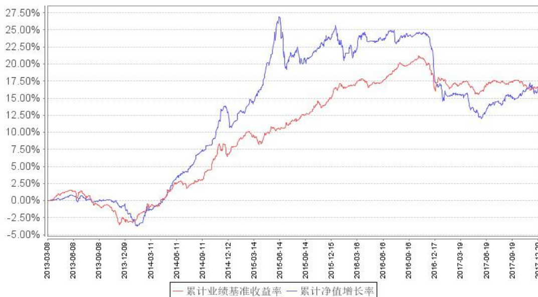
鹏华国企债债券累计净值增长率与同期业绩比较基准收益率的历史走势对比图