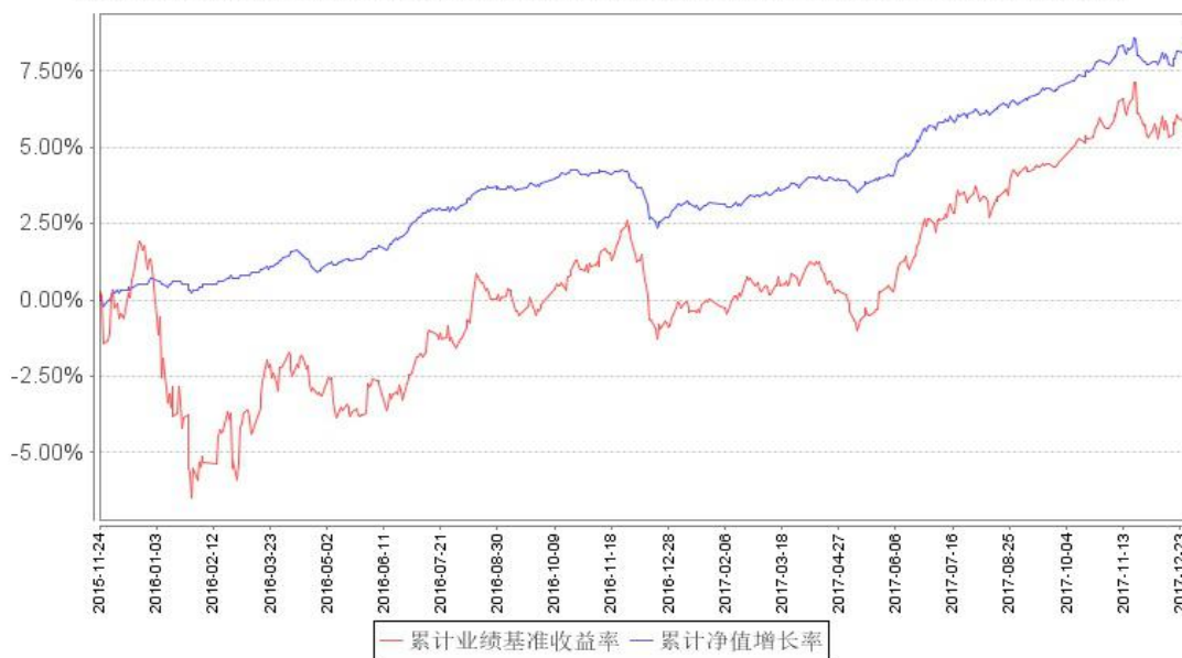
鹏华弘安A累计净值增长率与同期业绩比较基准收益率的历史走势对比图