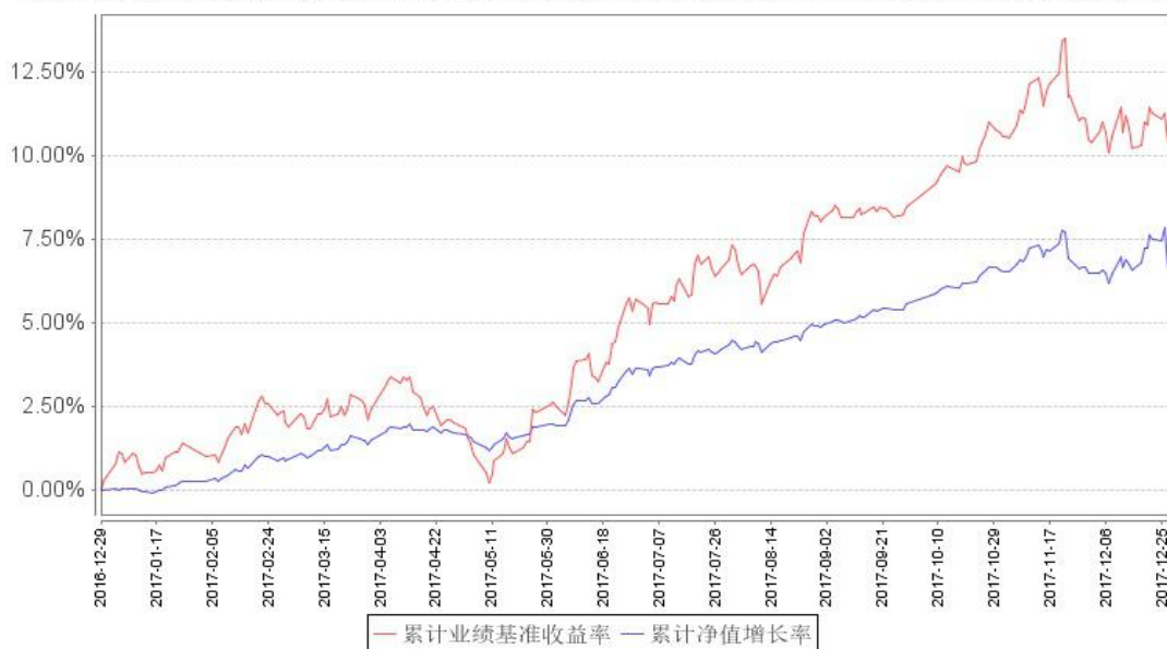
鹏华弘樽混合A类累计净值增长率与同期业绩比较基准收益率的历史走势对比图