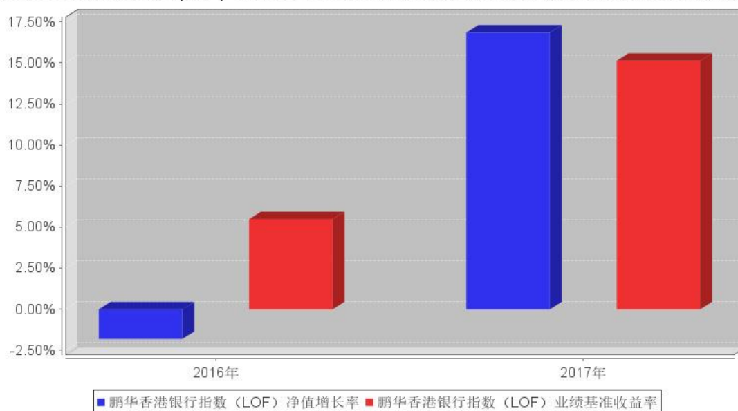
鹏华香港银行指数（LOF）基金每年净值增长率与同期业绩比较基准收益率的对比图