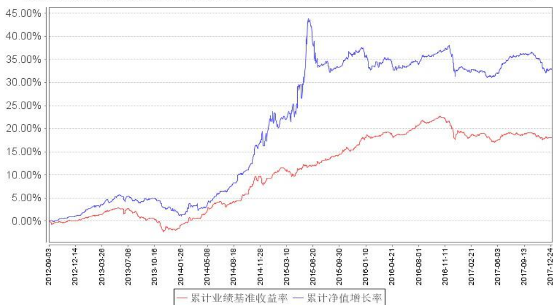
鹏华纯债债券累计净值增长率与同期业绩比较基准收益率的历史走势对比图