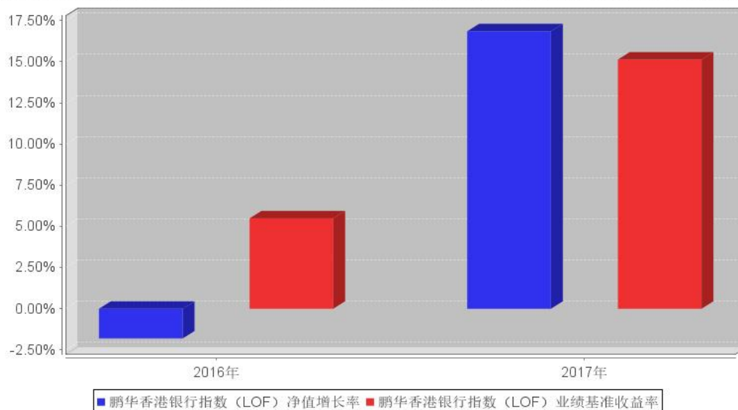
鹏华香港银行指数（LOF）基金每年净值增长率与同期业绩比较基准收益率的对比图