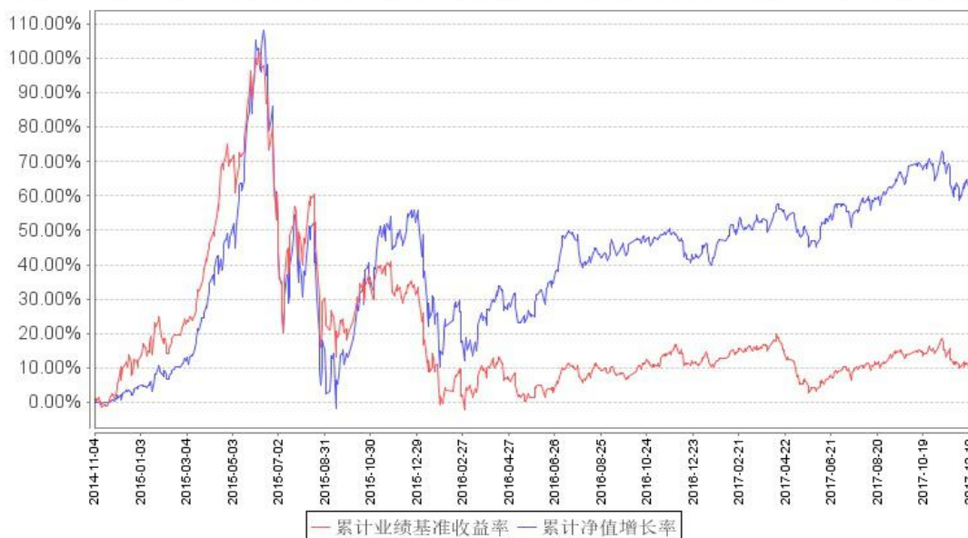
鹏华先进制造股票累计净值增长率与同期业绩比较基准收益率的历史走势对比图