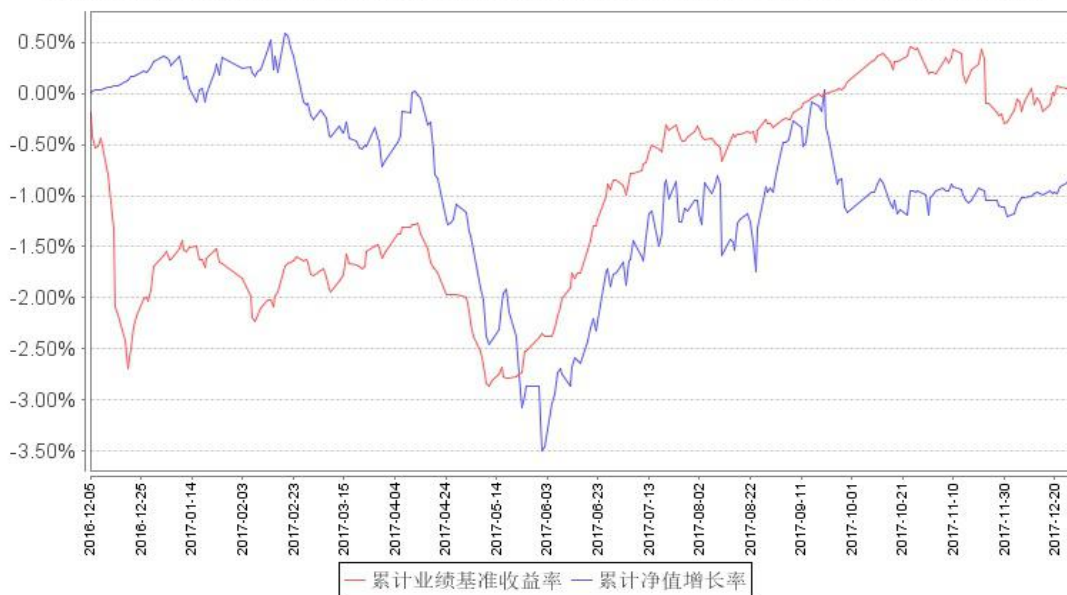
鹏华普泰债券累计净值增长率与同期业绩比较基准收益率的历史走势对比图