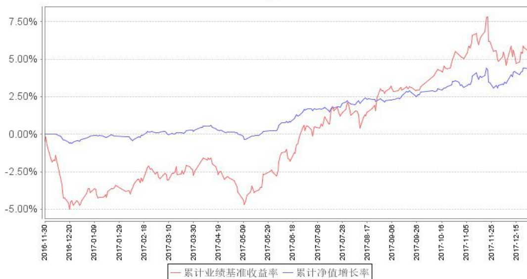
鹏华兴泰定期开放混合累计净值增长率与同期业绩比较基准收益率的历史走势对比图