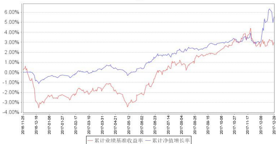
鹏华兴裕定期开放混合累计净值增长率与同期业绩比较基准收益率的历史走势对比图