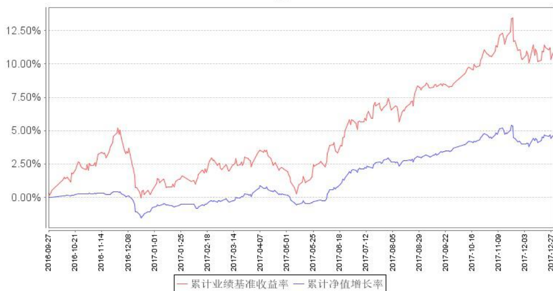
鹏华兴实定期开放混合累计净值增长率与同期业绩比较基准收益率的历史走势对比图