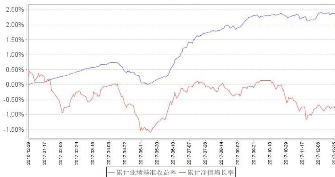
鹏华永盛定期开放债券累计净值增长率与同期业绩比较基准收益率的历史走势对比图

注：1、本基金基金合同于 2016 年 12 月 29 日生效。 2、截至建仓期结束，本基金的各项投资比例已达到基金合同中规定的各项比例。