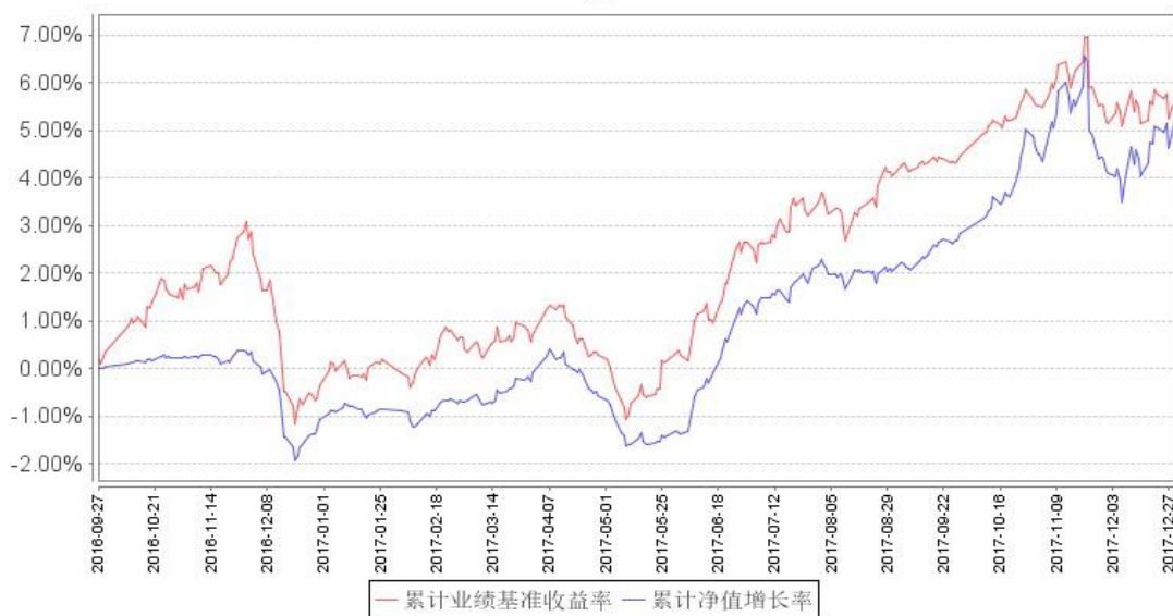
鹏华兴安定期开放混合累计净值增长率与同期业绩比较基准收益率的历史走势对比图