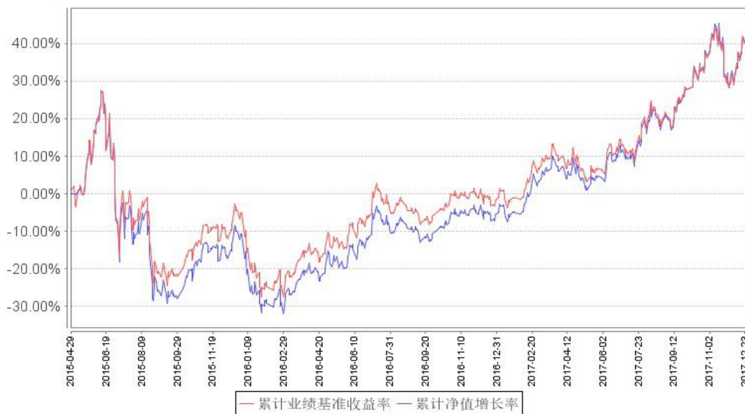
鹏华酒分级累计净值增长率与同期业绩比较基准收益率的历史走势对比图