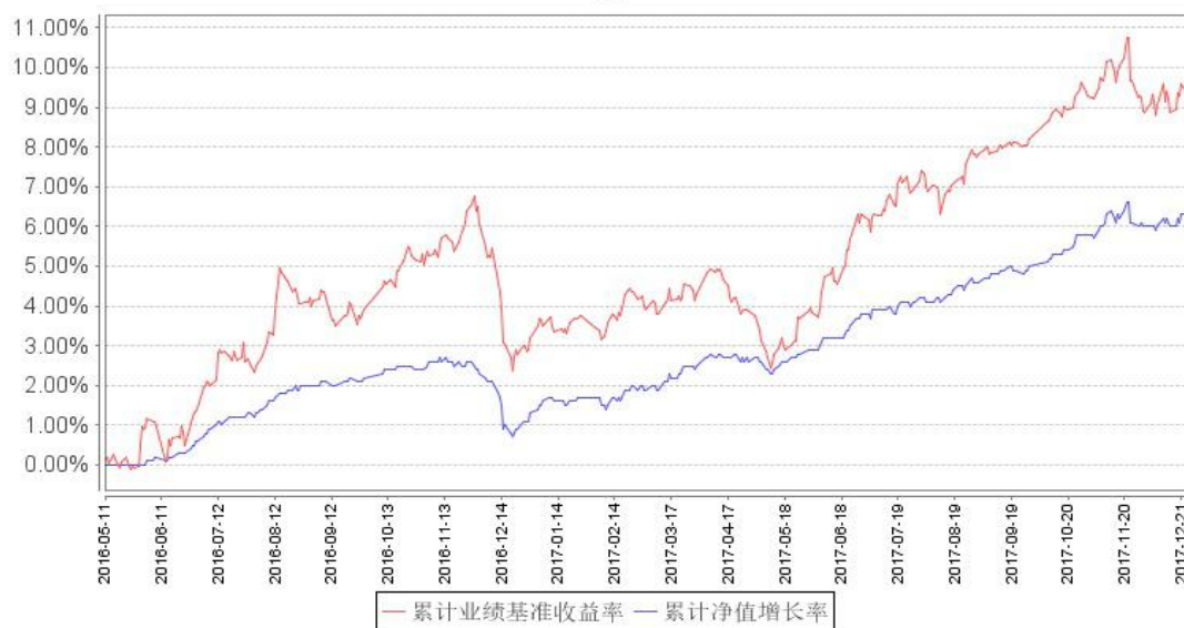
鹏华兴利定期开放混合累计净值增长率与同期业绩比较基准收益率的历史走势对比图