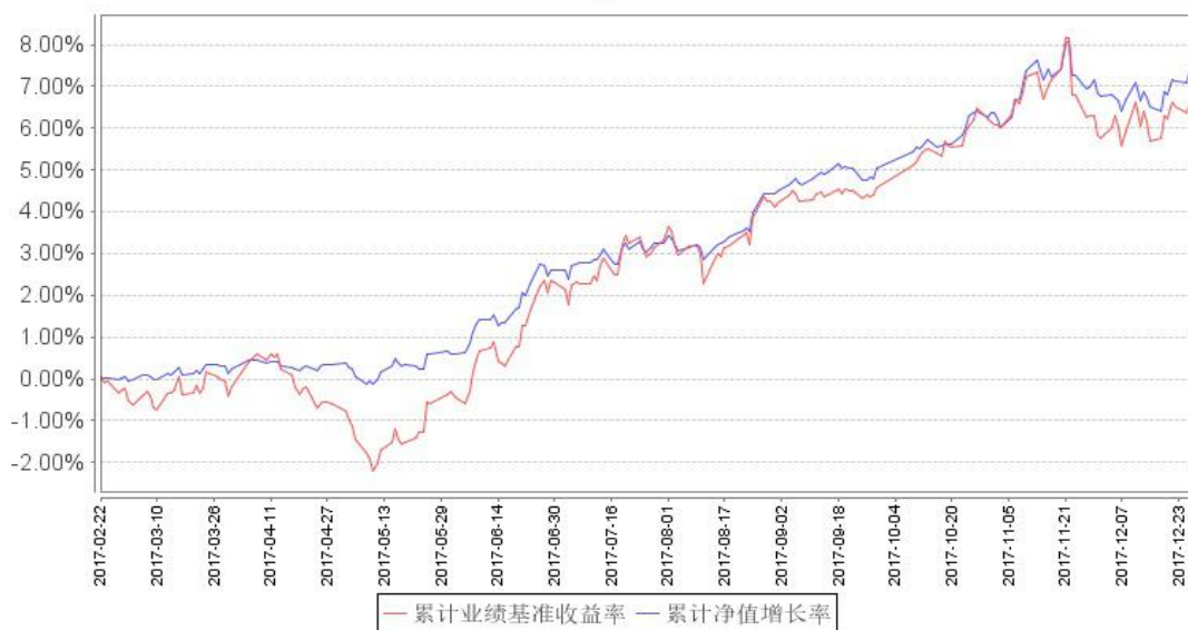
鹏华兴康定期开放混合累计净值增长率与同期业绩比较基准收益率的历史走势对比图

注：1、本基金基金合同于 2017 年 2 月 22 日生效，截至本报告期末本基金基金合同生效未满一年。