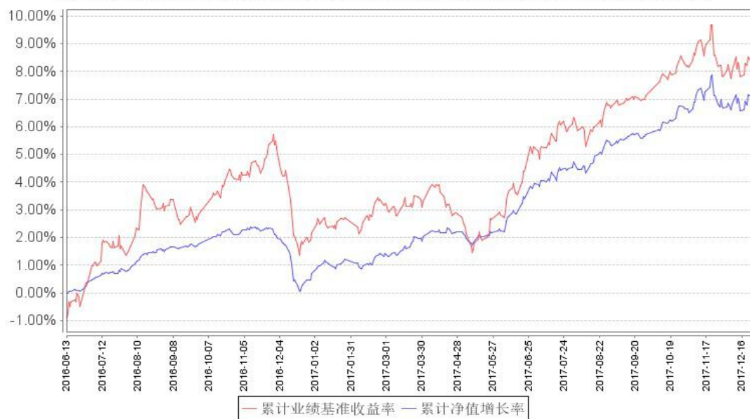
鹏华兴华累计净值增长率与同期业绩比较基准收益率的历史走势对比图

注：1、本基金基金合同于 2016 年 6 月 13 日生效。 2、截至建仓期结束, 本基金的各项投资比例已达到基金合同中规定的各项比例。