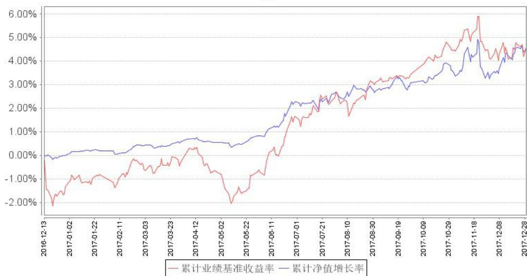
鹏华兴悦定期开放混合累计净值增长率与同期业绩比较基准收益率的历史走势对比图