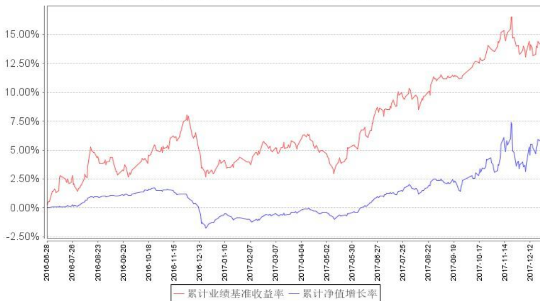
鹏华兴益累计净值增长率与同期业绩比较基准收益率的历史走势对比图