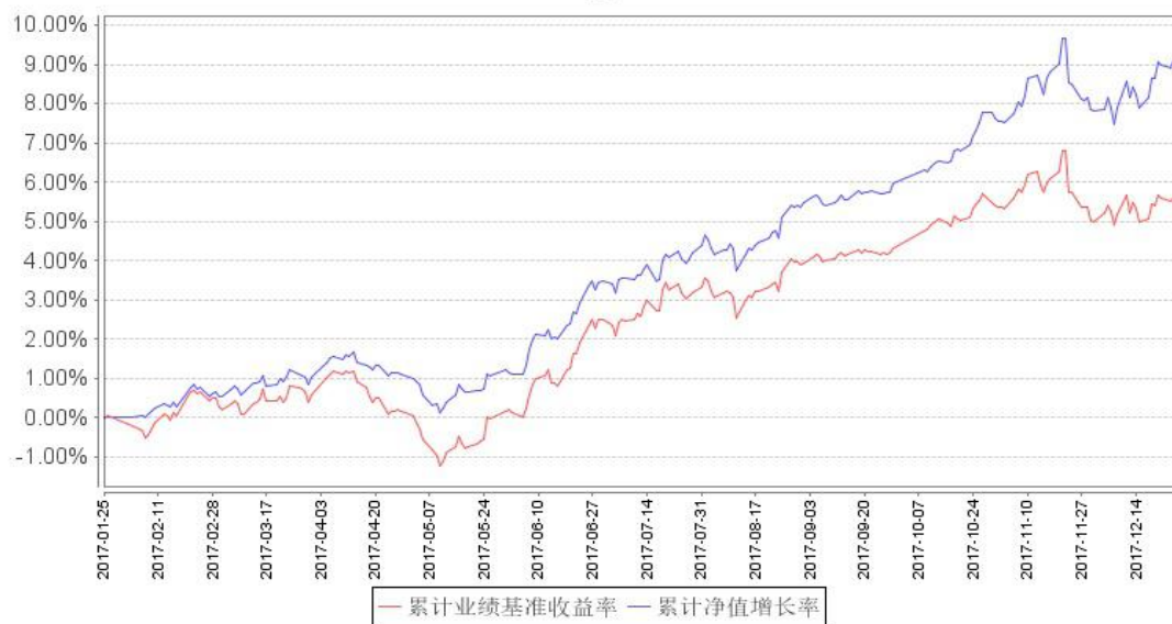
鹏华兴惠定期开放混合累计净值增长率与同期业绩比较基准收益率的历史走势对比图

注：1、本基金基金合同于 2017 年 1 月 25 日生效，截至本报告期末本基金基金合同生效未满一年。