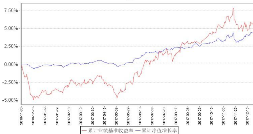
鹏华兴泰定期开放混合累计净值增长率与同期业绩比较基准收益率的历史走势对比图