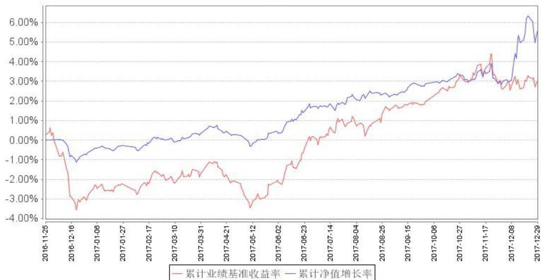
鹏华兴裕定期开放混合累计净值增长率与同期业绩比较基准收益率的历史走势对比图