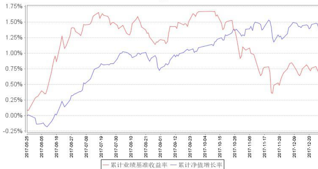
鹏华永泰定期开放债券累计净值增长率与同期业绩比较基准收益率的历史走势对比图

注：1、本基金基金合同于 2017 年 5 月 25 日生效，截至本报告期末本基金基金合同生效未满一年。