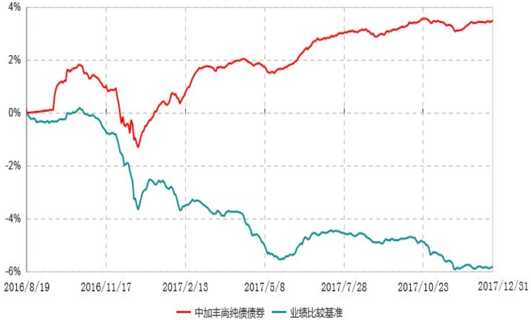
中加丰尚纯债债券型证券投资基金累计净值增长率与业绩比较基准收益率历史走势对比图 (2016年08月19日-2017年12月31日)