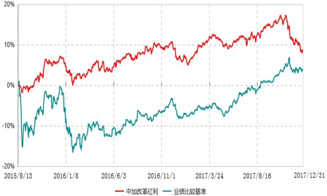
中加改革红利灵活配置混合型证券投资基金累计净值增长率与业绩比较基准收益率历史走势对比图 (2015年08月13日-2017年12月31日)