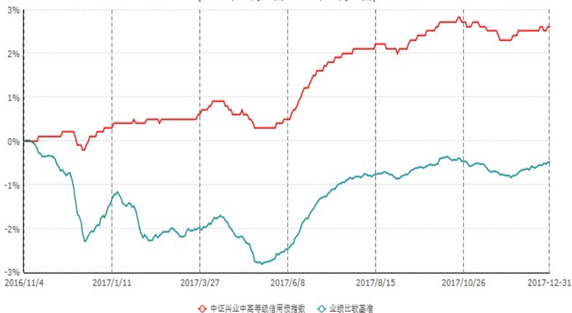
中证兴业中高等级信用债指数证券投资基金累计净值增长率与业绩比较基准收益率历史走势对比图 (2016年11月04日-2017年12月31日)

本基金合同于2016年11月04日生效，根据本基金基金合同规定，本基金自基金合同生效之日起六个月内已使基金的投资组合比例符合基金合同的约定。