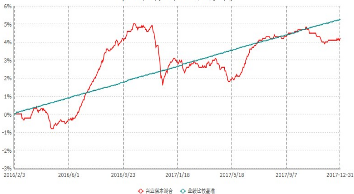
兴业保本混合型证券投资基金累计净值增长率与业绩比较基准收益率历史走势对比图 (2016年02月03日-2017年12月31日)