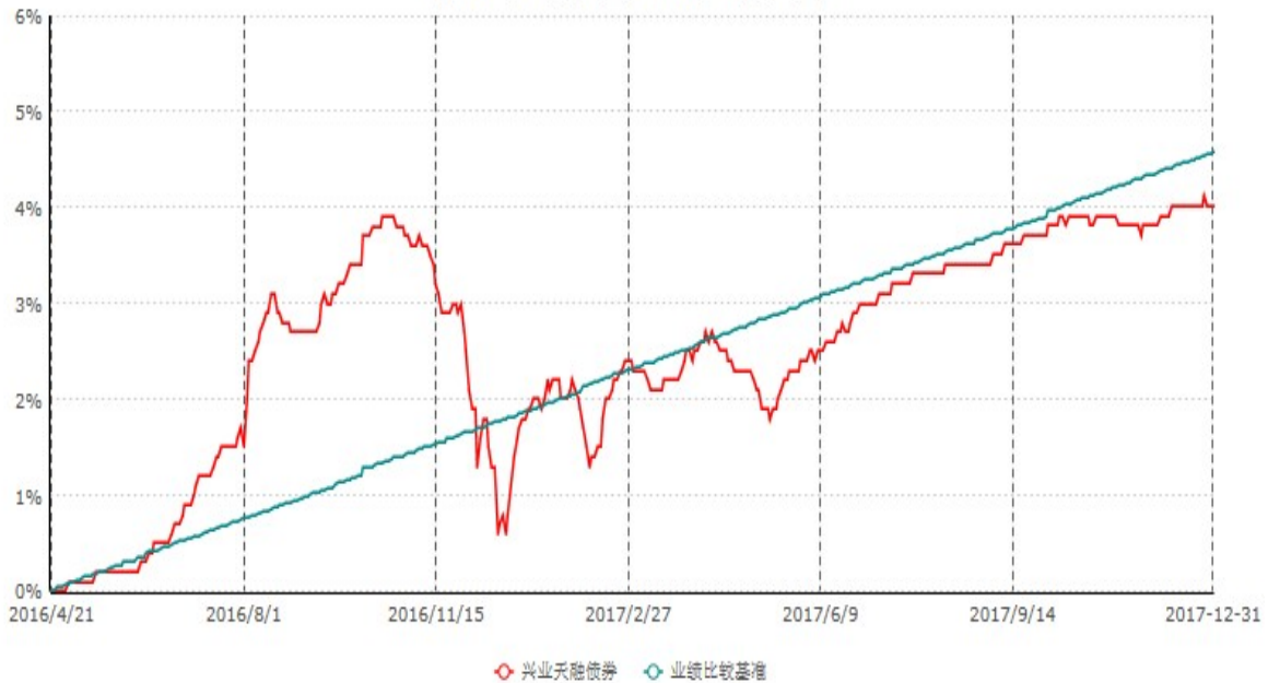
兴业天融债券型证券投资基金累计净值增长率与业绩比较基准收益率历史走势对比图 (2016年04月21日-2017年12月31日)