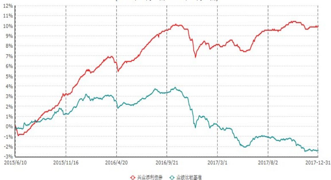
兴业添利债券型证券投资基金累计净值增长率与业绩比较基准收益率历史走势对比图 (2015年06月10日-2017年12月31日)