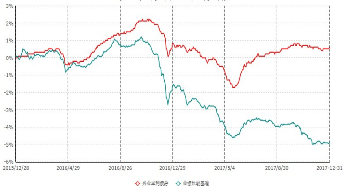
兴业丰利债券型证券投资基金累计净值增长率与业绩比较基准收益率历史走势对比图 (2015年12月28日-2017年12月31日)