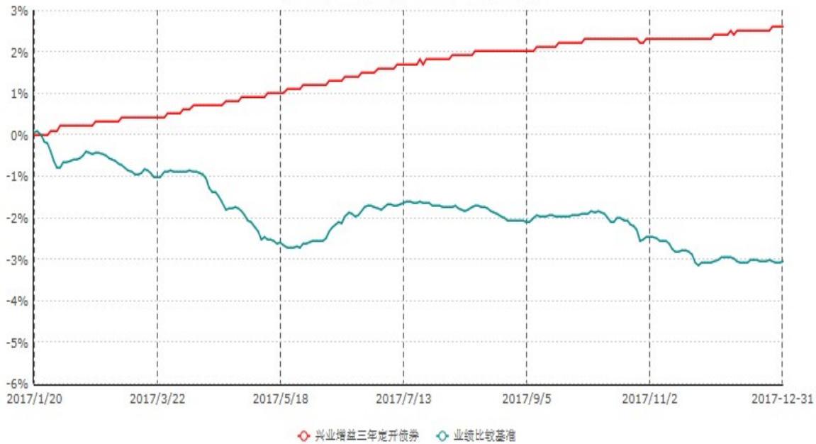
兴业增益三年定期开放债券型证券投资基金累计净值增长率与业绩比较基准收益率历史走势对比图 (2017年01月20日-2017年12月31日)

注：1、本基金基金合同于2017年1月20日生效，截至报告期末本基金基金合同生效未 满一年。